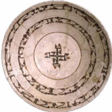
قدح سفالی، سبک خراسان، سده ۴ هـ ق

سکه طلا (دینار) بدون تصویر در سال ۷۷ هجری ضرب شد، که سوره توحید در یک طرف آن دیده می شود.