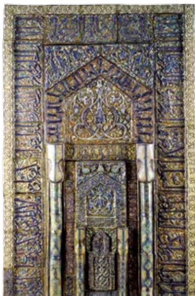
محراب کاشی زرین‌فام معروف به در بهشت، سال ۷۲۴ ه‍.ق