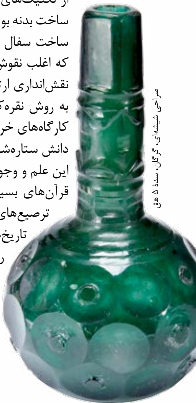
سراچی شیشه‌ای، گرگان، سده ۵ هق

روش ویژهٔ سلجوقیان در پارچه‌بافی به‌ویژه ابریشم‌بافی به شیوهٔ «رنگ و نیم‌رنگ» بود. در این شیوه پودها را طوری می‌بافتند که نقوش نسبت به زمینه برجسته و براق به نظر می‌آید، در حالی که زمینه و نقوش یک‌رنگ بودند. آجرکاری و گچبری، از متداول‌ترین روش‌های تزئینی در معماری سلجوقی است که، در بسیاری از بناهای این دوره به‌کار رفته است.