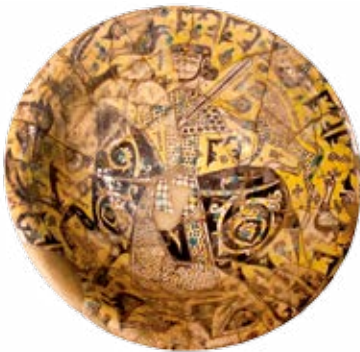
قدح سفالی، نیشابور خراسان رضوی، سده ۳ و ۴ هـ ق

لعاب دار، نقاشی روی پوشش گلی زیر لعاب شفاف، لعاب پاشیده و زرین فام است. در سده های اولیه اسلامی بندر سیراف از مراکز ساخت آبگینه و نیشابور مرکز بازرگانی و محل ص دور کالا به شهرهای دیگر بود و شیشه های ساخت این شهر و شهرهای دیگر چون ری و گرگان در آنجا خرید و فروش می شد.