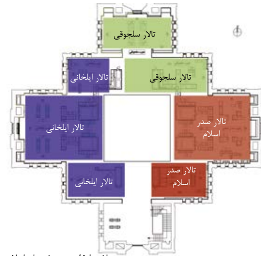
پلان طبقه دوم موزه دوران اسلامی

موزه دوران اسلامی براساس پلانی الهام گرفته از کاخ ساسانی بیشاپور، به صورت چلیپایی هشت‌ضلعی، با مساحتی حدود ۴۰۰۰ متر مربع و در سه طبقه ساخته شد. این بنا به منظور تأسیس موزه دوران اسلامی تجهیز و در سال ۱۳۷۵ افتتاح شد. در اول تیرماه ۱۳۸۵ با هدف اصلاح و تکمیل تأسیسات، گسترش برخی فضاها و بازنگری در چگونگی نمایش آثار، این موزه برای بازسازی تعطیل شد و بار دیگر در سال ۱۳۹۴ با تغییراتی در فضاهای داخلی و چیدمان بازگشایی شد. طبقه همکف این بنا به سالن اجتماعات و سالن نمایشگاه‌های موقت اختصاص دارد. آثار موزه دوران اسلامی در دو طبقه اول و دوم، بر اساس زمان‌بندی تاریخی چیدمان شده است، بازدید از طبقه دوم شروع می‌شود و در طبقه اول به پایان می‌رسد. موزه کنونی شامل ۶ تالار در دو طبقه است: طبقه دوم شامل تالارهای صدر اسلام، سلجوقی و ایلخانی و طبقه اول تالارهای قرآن، تیموری، صفویه، افشار، زند و قاجار می‌باشد. عمده اشیاء موجود در این موزه برگزیده‌ای از آثار حاصل از کاوش‌های علمی یا مجموعه‌های معتبری چون آستان شیخ‌صفی‌الدین اردبیلی است.