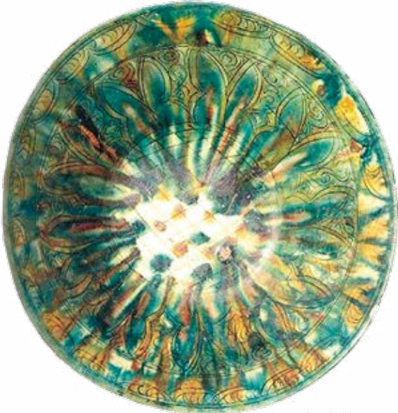
کاسه سفالی، نیشابور، سده های ۳-۴ هـ ق

شهرهای ری و نیشابور کارگاه های عمده پارچه بافی داشتند. ری به تولید پارچه های ابریشم «دوپودی» و شوش و شوشتر به بافت «طراز» شهره بودند. کهن ترین پارچه این تالار قطعه پارچه ابریشم «دورو» است است که از کاوش های ری به دست آمده و روی آن نقوش تزئینی ساسانی در کنار کتیبه هایی به خط کوفی دیده می شود.