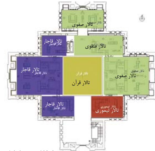
پلان طبقه اول موزه دوران اسلامی