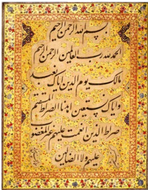
قطعه خط رقم عمادالحسنی، سده ۱۱ هجری

در این تالار، قطعه پارچه‌ای به نمایش درآمده که با آیات قرآنی به خط کوفی، نسخ، ثلث و غبار با قلم لاجورد، شنگرف، طلا و زعفران کتابت شده است. این شاهکار را خطاط