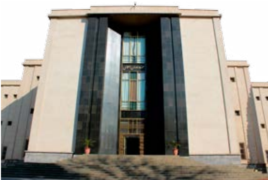
نمایی از موزه دوران اسلامی