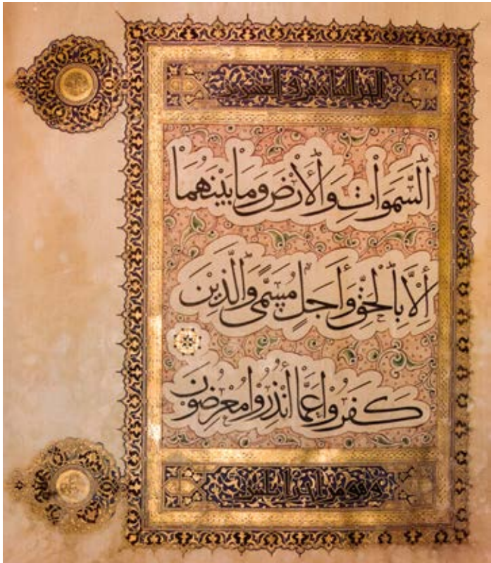
قرآن کریم به خط محقق، رقم احمد سهروردی، سده ۸ هجری

در این دوره شهرهای هرات، تبریز، کاشان و کرمان از مهم‌ترین مراکز بافت پارچه و قالی بودند. در اواخر دوره ایلخانی و اوایل دوره تیموری، هنر کاشیکاری در زیباترین شکل خود، یعنی «معرق» تجلی یافت. در معرق از رنگ‌های سفید، آبی تیره، زرد، فیروزه‌ای و سبز استفاده می‌شود. تکنیک معرق در سده نهم هجری در مشهد و اصفهان به اوج رسید. در دوره تیموری ساخت سفالینه با تکنیک نقاشی زیر لعاب و ظروف یکرنگ و همچنین سفال آبی و سفید با نقش‌مایه‌های ایرانی و چینی متداول بود.