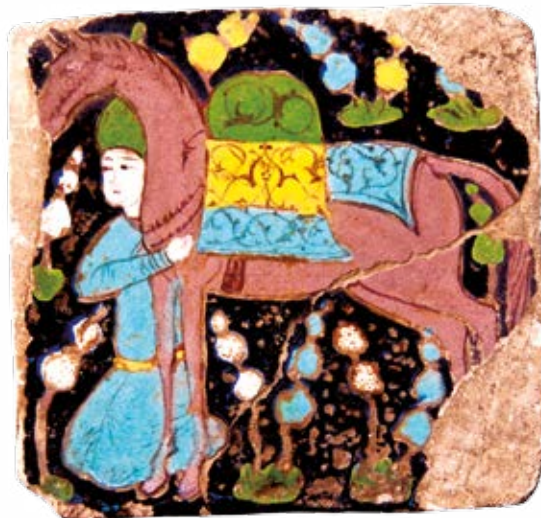
کاشی، نیشابور، خراسان رضوی، سدهٔ ۱۱-۱۰ ه‍.ق

صنعت و هنر قالی‌بافی با طرح‌های گلدانی، باغی، کتیبه‌ای، محرابی و لچک ترنج به اوج زیبایی رسید و انواع قالیچه‌های تمام‌ابریشم، با تاروپود ابریشم و پُرز گلابتون و نیز قالیچهٔ پشمی بافته شد. آثار بسیار زیبای فلزی به شیوهٔ تزئینی قلمزنی و مشبک‌کاری در کارگاه‌های غرب ایران و اصفهان ساخته می‌شد و صنعت سفالگری به شیوهٔ «آبی‌وسفید» در مراکز کرمان، مشهد و یزد رواج داشت. شاه‌عباس به دلیل علاقهٔ به ظروف چینی، مجموعه‌ای نفیس گردآورد و وقف بقعهٔ