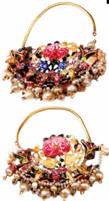
گوشواره زرین میناکاری و مرصع، شمال ایران، سده ۱۳ ه‍.ق

میان‌پرده‌های کوتاه حکومتی و سیاسی افشار و زند پیامد سیاسی و فرهنگی مهمی را در تاریخ ایران به نام دوره قاجار در بر داشت. سبک‌های هنری افشاریان و زندیان از یک‌سو ریشه در دوره بلندمدت پیش از خود دارد و از سوی متأثر از تحولات اجتماعی و سیاسی عصر خود است. در سده‌های دوازدهم و سیزدهم هجری قمری شاهد پیشرفت برخی هنرها مانند خاتم‌کاری و آینه‌کاری روی چوب و فولادهای طلاکوب زیبا و نقره‌های میناکاری شده هستیم. در زمان قاجار صنایع فلزی، به‌ویژه صنعت فولادسازی و اسلحه‌سازی پیشرفت کرد. کاربرد «کاشی هفت رنگ» دوره صفوی نیز تا دوره قاجار ادامه یافت. نگارگری در