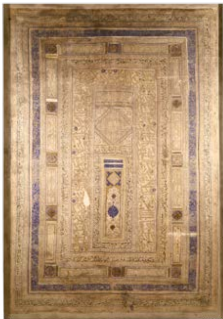
پارچهٔ کتانی با خطوط کوفی، نسخ، ثلث و غبار، سال ۹۴۵ ه‍.ق

تزئینات معماری زیبایی به صورت کاشی معرق از این زمان برجای مانده که از نظر رنگ زمینه و نقوش با معرق دورهٔ تیموری متفاوت است. از ویژگی‌های کاشیکاری این دوره «کاشی هفت رنگ» است که بر روی آن به رنگ‌های گوناگون نقاشی می‌کردند.